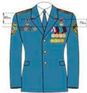
на кителе при парадной форменной одежде