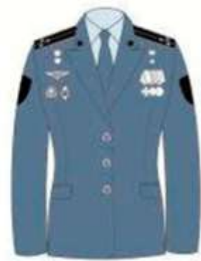
на жакете при парадной форменной одежде