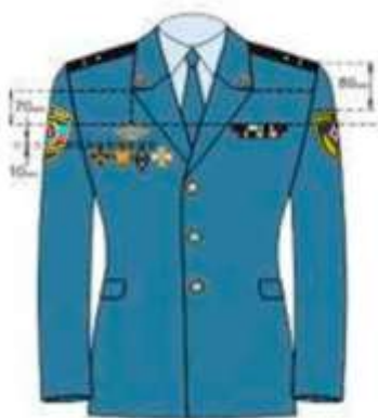
на кителе при повседневной форменной одежде