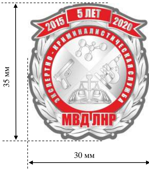
Аверс юбилейного нагрудного знака