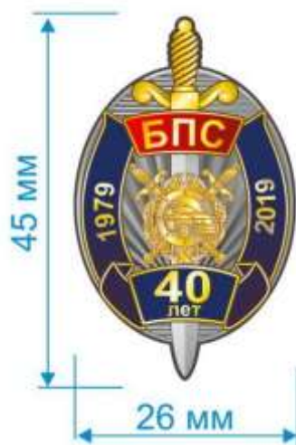
Аверс нагрудного знака